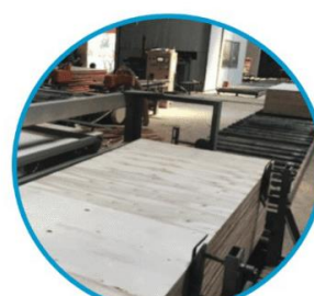
Chà nhám, cắt cạnh