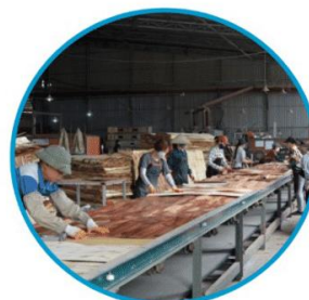
Xếp ván độn