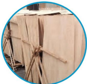
Chọn nguyên liệu